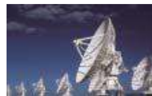
Quyền của các tổ chức phát sóng độc lập với quyền tác giả của các bộ phim, tác phẩm âm nhạc hay các tài liệu được truyền phát khác.

Ở một số nước, các tổ chức phát sóng có quyền cho phép hoặc ngăn cấm việc truyền hình theo yêu cầu bản các bản định hình của chương trình phát sóng đến các thuê bao riêng lẻ và cho phép công chúng tiếp cận các bản định hình lưu trong cơ sở dữ liệu của máy tính thông qua mạng Internet. Nhưng nhiều nước khác, trong các quy định của pháp luật về quyền tác giả và quyền liên quan, lại không coi truyền thanh và truyền hình qua Internet là hoạt động phát sóng. Ở một số nước, các tổ chức phát sóng cũng có quyền cho phép hoặc ngăn cấm việc truyền hình qua hệ thống cáp quang các chương trình phát sóng của mình.