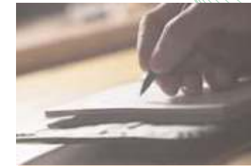
Việc chuyển nhượng hoặc li-xăng độc quyền phải được thể hiện bằng văn bản.

Ở một số ít các nước, quyền tác giả không thể bị chuyển nhượng hoàn toàn. Ngoài ra, xin nhớ rằng chỉ có thể chuyển nhượng các quyền kinh tế vì quyền nhân thân luôn luôn gắn liền với tác giả (xem trang 17).