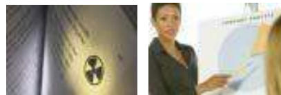
Tài liệu hướng dẫn bảo dưỡng máy móc và bài thuyết trình được bảo hộ quyền tác giả.

Pháp luật quyền tác giả trao cho tác giả và nhà sáng tạo tác phẩm một tập hợp gồm nhiều độc quyền đối với tác phẩm của họ trong một khoảng thời gian nhất định, nhưng thường khá dài. Những quyền này giúp cho tác giả có thể kiểm soát việc sử dụng tác phẩm của mình vì mục đích kinh tế theo nhiều cách khác nhau và nhận được tiền thù lao. Pháp luật quyền tác giả cũng quy định về “quyền tinh thần” nhằm bảo vệ danh tiếng của tác giả và sự toàn vẹn của tác phẩm.