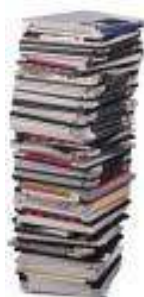
Âm nhạc và đĩa video