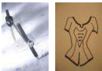
Bản thảo và bản vẽ kỹ thuật của các thiết kế, các vật dụng được thiết kế, máy móc, đồ chơi, vải, v.v. đều được bảo hộ quyền tác giả.

Việc sáng tạo một tác phẩm nguyên gốc đòi hỏi công sức, kỹ năng, thời gian, sự khéo léo, sự lựa chọn hoặc những nỗ lực về mặt tinh thần. Tuy vậy, một tác phẩm được bảo hộ quyền tác giả lại không tính đến các yếu tố sáng tạo, chất lượng hay giá trị , và không cần có tính văn học hoặc nghệ thuật. Quyền tác giả cũng được áp dụng đối với, ví dụ các nhãn mác trên bao bì, công thức nấu ăn, hướng dẫn về mặt kỹ thuật đơn thuần, hướng dẫn sử dụng hoặc bản vẽ kỹ thuật cũng như bức tranh của một đứa trẻ lên ba.